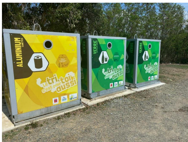
PAV au niveau de Port Ouenghi